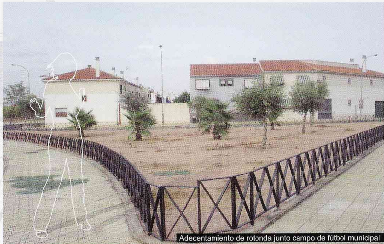
Adecantamiento de rotonda junto campo de fútbol municipal