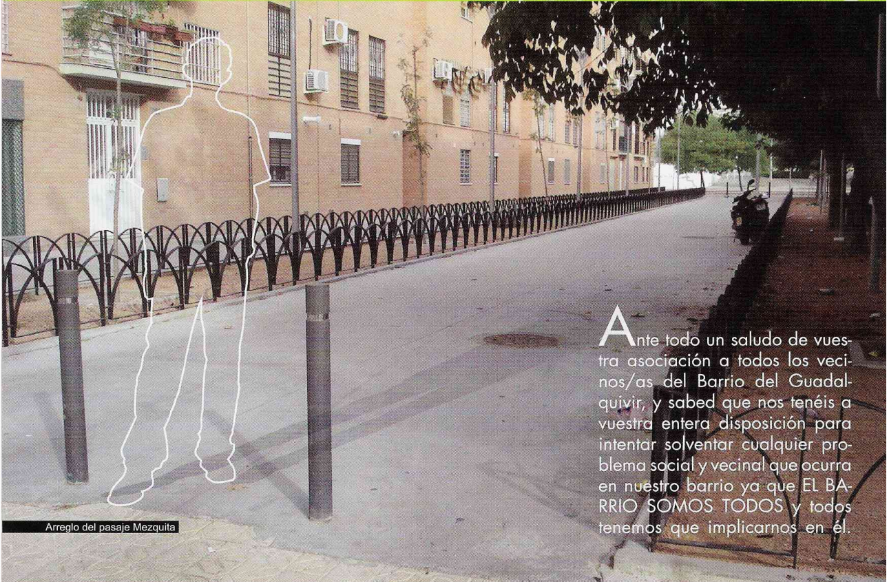
Arreglo del pasaje Mezquita

Ante todo un saludo de vuestra asociación a todos los vecinos/as del Barrio del Guadalquivir, y sabed que nos tenéis a vuestra entera disposición para intentar solventar cualquier problema social y vecinal que ocurra en nuestro barrio ya que EL BARRIO SOMOS TODOS y todos tenemos que implicarnos en él.