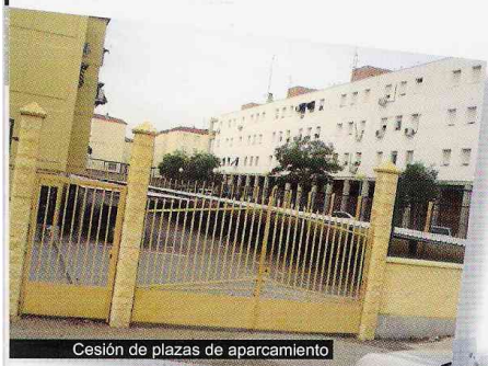
Cesión de plazas de aparcamiento