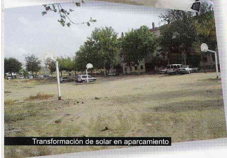
Transformación de solar en aparcamiento

Ni decir tiene que todo esto sin el apoyo de nuestros asociados no sería posible, y hacemos un llamamiento a todos los vecinos del Barrio del Guadalquivir para que en base a la unión y el esfuerzo de todos, encabezada por nuestra asociación vecinal podamos realizar la transformación definitiva de este barrio, que es lo que la inmensa mayoría de nosotros queremos, ya que la unión hace la fuerza y estamos seguros que en este barrio viven infinidad de personas muy capacitadas y emprendedoras que puedan ayudar a crear y poner en marcha proyectos de futuro para que nuestros hijos puedan crecer y desarrollarse en paz y armonía con sus semejantes.