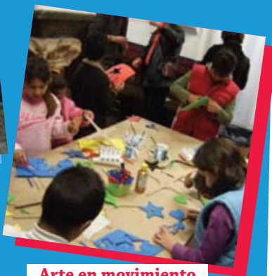
Arte en movimiento