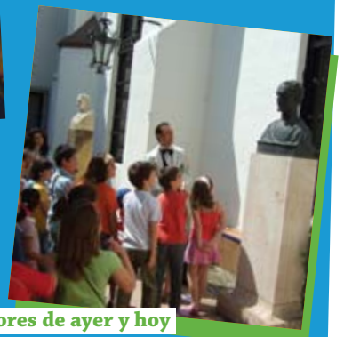
Pintores de ayer y hoy