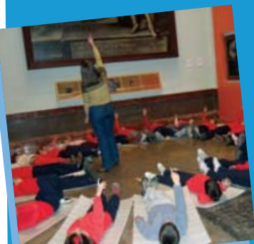
Pintores del cielo

Debe solicitarse cita previa hasta completar un número máximo de 20 asistentes. Los talleres tendrán una duración máxima de dos horas, comenzando a las 12:00 horas. Para más información contactar con el museo.